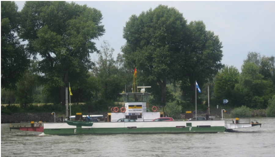
Abbildung: Die Kollerfähre

Für die Bewirtschaftung des größten Teils der Kollerinsel sowie für die Kollerfähre ist der Landesbetrieb Vermögen und Bau Baden-Württemberg (Vermögen und Bau) zuständig.