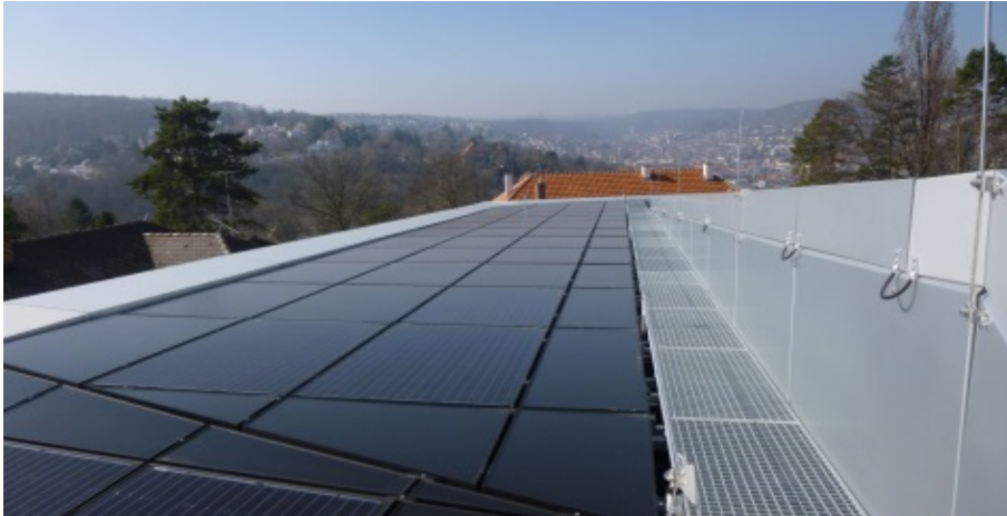
Abbildung 3: Anlage ohne Neigung (Neubau am Staatsministerium)

Die Photovoltaikanlagen auf dem Haus der Abgeordneten in Stuttgart und beim Landwirtschaftlichen Zentrum Baden-Württemberg in Aulendorf waren durch Laub und Staub stark verschmutzt.