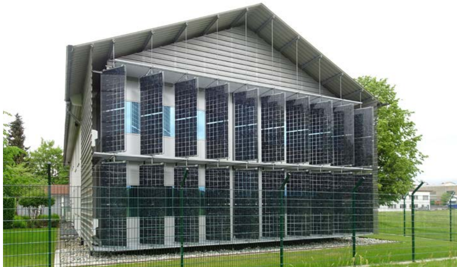
Abbildung 5: In die Fassade integrierte Photovoltaikanlage in Kißlegg

Bei dem 2016 errichteten Verkehrskommissariat in Kißlegg kostete die in die Fassade integrierte Photovoltaikanlage annähernd 5.000 Euro je Kilowatt peak. Bei konventionellen Dach-Anlagen mit größerer Modulfläche konnte das Land deutlich günstigere spezifische Preise von weniger als 2.000 Euro je Kilowatt peak erzielen. Nach Berechnungen des Rechnungshofs wird die Photovoltaikanlage in Kißlegg mit einer Spitzenleistung von nur 7 Kilowatt peak die Investitionskosten von mehr als 30.000 Euro während ihrer technischen Lebensdauer nicht erwirtschaften können.