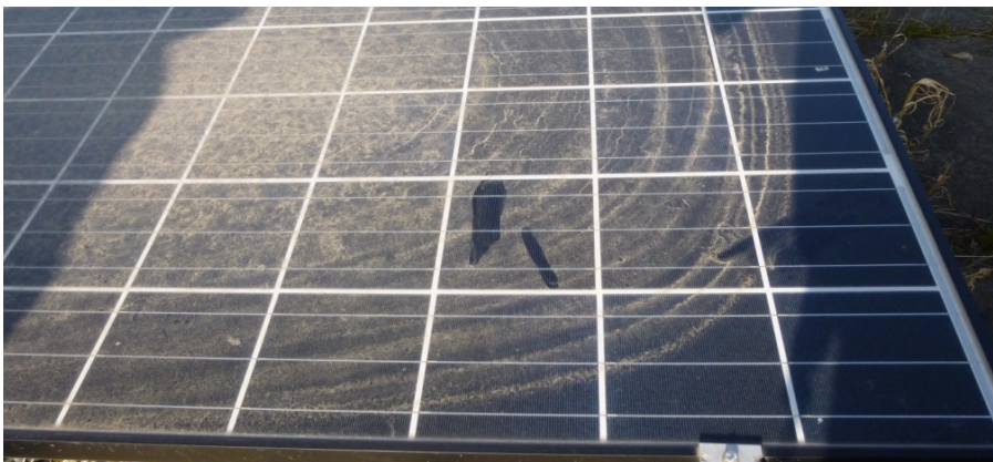
Abbildung 4: Mangelhafte Reinigung (Haus der Abgeordneten)

Die Photovoltaikanlagen sind in der Regel auf Flach- oder Satteldächern installiert. Bei den Anlagen am Verkehrskommissariat in Kißlegg und der Hochschule in Esslingen wurden die Module vom Architekten gestalterisch in die Fassade integriert. Diese technisch sehr aufwendige Lösung kommt nur für sehr kleine Anlagen in Frage. Außerdem führt sie zu nicht optimaler Ausrichtung der Anlage, überdurchschnittlich hohen spezifischen Investitionskosten und zusätzlichen Architekten-Honoraren.