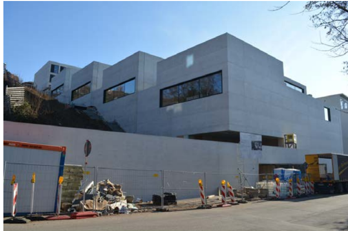
John-Cranko-Schule im Bau, Feb. 2019

In fünf von 20 Planungswettbewerben machte das Land keine Kostenvorgaben. Auch wenn verbindliche Kostenobergrenzen in der Auslobung genannt waren, hielt die Mehrheit der Wettbewerbsarbeiten diese nicht ein. In keinem Fall führte eine Überschreitung der Kostenobergrenze dazu, dass die betreffende Arbeit von der Beurteilung ausgeschlossen wurde.